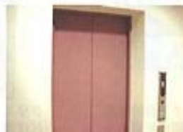
エレベーター (女性用)