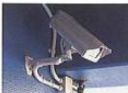
セキュリティカメラ