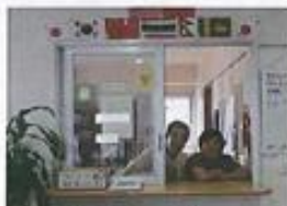
定期清掃 (イメージ)