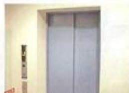
エレベーター (男性用)